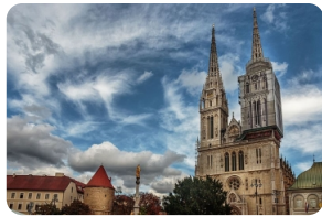
圣母升天大教堂 (萨格勒布大教堂)