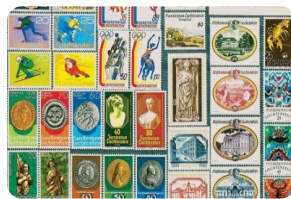
列支敦士登邮票博物馆