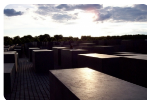
犹太人大屠杀纪念碑群