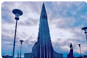
哈尔格林姆斯教堂