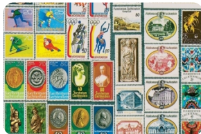
列支敦士登邮票博物馆