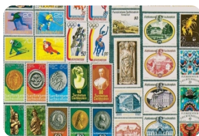
列支敦士登邮票博物馆