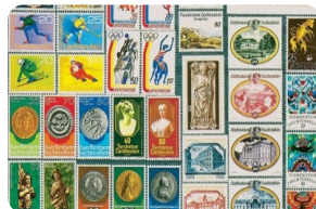
列支敦士登邮票博物馆