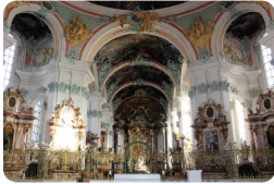
圣加仑修道院和图书馆