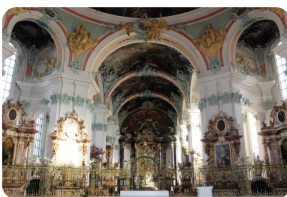
圣加伦修道院和图书馆