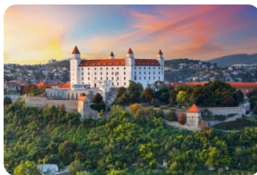
布拉迪斯拉发城堡