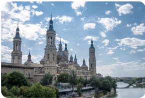
比拉尔圣母大教堂