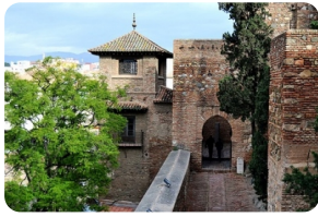
马拉加阿尔卡萨瓦城堡

https://www.alcazarsevilla.org/en/schedules-rates/