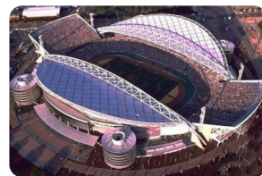
巴塞罗那奥林匹克体育场