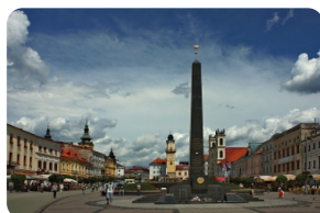
斯洛伐克民族起义广场