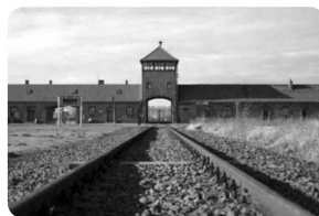
奥斯维辛毒气室和灭绝营（二营）

奥斯维辛集中营位于克拉科夫西南方的奥斯维辛市，是二战时期德国在波兰建立的劳动营和灭绝营之一，如今这里已经成为了著名的纪念地和博物馆。当地有两个营地，一个较大的奥斯维辛集中营主营和小一些的奥斯维辛-比克瑙第二阵营。