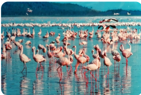
纳库鲁湖国家公园