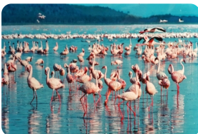
納庫魯湖國家公園