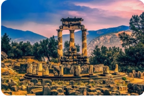
德尔菲遗址和博物馆

*由于途经阿拉霍瓦小镇当地不可抗力山体落石导致道路封闭，目前官方尚未给到具体公路开放的明确日期。如果道路持续关闭，将影响原行程“阿拉霍瓦小镇”无法途经参观。如团队行程当日道路畅通安全，原行程不变。如团队行程当日道路持续关闭，则直接前往德尔菲博物馆。