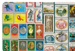
列支敦士登邮票博物馆