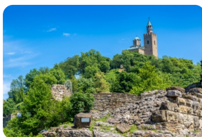
大特爾諾沃古城堡