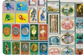
列支敦士登郵票博物館