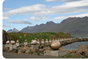
鳥蛋Eggin i Gledivik