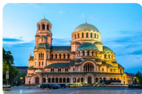
亚历山大·涅夫斯基大教堂