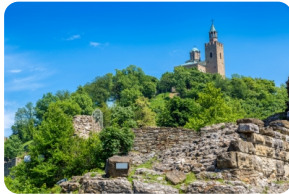
大特尔诺沃古城堡