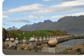
鳥蛋Eggin i Gledivik