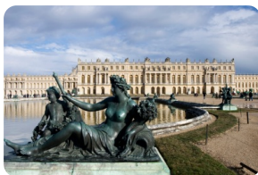
凡尔赛宫 [凡尔赛宫]

https://billetterie.chateauversailles.fr/palace-ticket-visite-chateau-css5-chateauversailles-lgen-pg51-ei755927.html