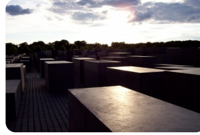
犹太人大屠杀纪念碑群

柏林仅存的城门，最重要的城市标志，象征了德意志的神圣统一，柏林人对勃兰登堡门怀有特殊的感情，称它为“命运之门”，成为柏林乃至德国的标志。