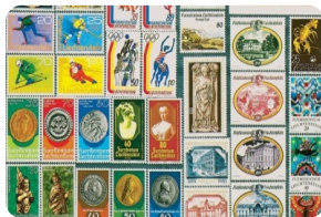
列支敦士登邮票博物馆