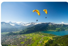
因特拉肯滑翔伞-夏天