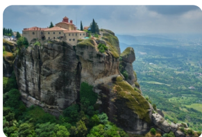
梅黛奥拉天空之城

(注：6座修道院的开放时间各不相同，视当天情况选择可以参观的修道院，一般参观2座修道院。修道院有严格的着装规定，不得裸露肩膀或膝盖，女性必须穿裙子。如果没有裙子，修道院门口提供围裙可以借用，请在入场前借一条。)