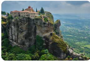
梅黛奧拉天空之城

(注：6座脩道院的開放時間各不相同，祇備天情況選擇可以漫觀的脩道院，一般漫觀2座脩道院。脩道院有嚴格的著裝規定，不得裸露肩膀或膝蓋，女性必須穿裙子。如果沒有裙子，脩道院門口提供圍裙可以借用，請在入場前借一條。)